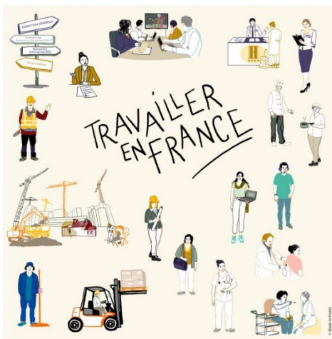
Cours de français professionnel en ligne et gratuit À partir du niveau A2